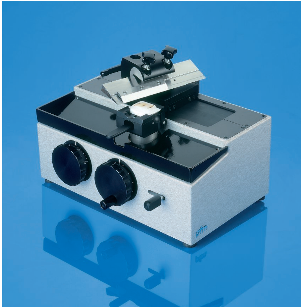
pfm Slide 2002 – Schlittenmikrotom