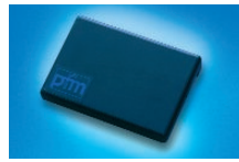
Fingerschutz mit Magnethalterung REF 010007