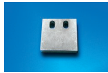
Distanzstück REF 010005