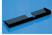
Schnittabfallwanne REF 010006