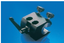
Messerhalter REF 010002