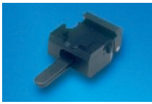
Universal Kassettenklammer nicht orientierbar REF 101108