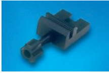
Standard Objektklammer nicht orientierbar max. Probengröße 40 x 45 mm REF 010004